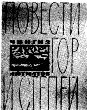
في السبعينات غلاف اول مجموعة قصصية للكاتب «قصص الجبال والسهوب» .